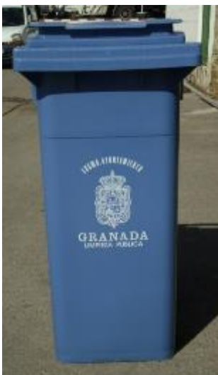
(contenedor de papel y cartón)

El papel recogido de las cestas es depositado en contenedores retornables de 360 litros, color azul, asignados a cada colegio o centro que deberán sacar al punto de recogida (en nuestro caso junto a Secretaria).