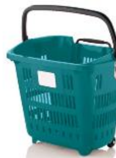
(papelera de clase)