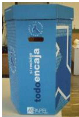
(papelera de pasillo)